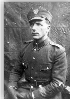
Командир сотні УПА