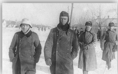
Німецькі солдати у полоні