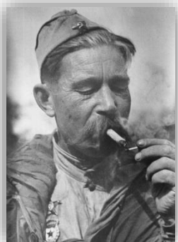
Солдат - піхотинець