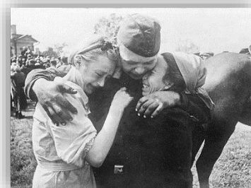
Солдат, що повернувся з війни додому