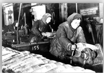
Жінки у тилу на заводі