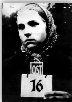
Дівчина – оstarбайтер, насильно вивезена на роботу до Німеччини