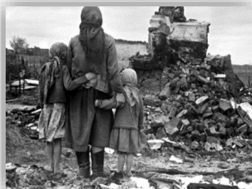
Жінка з дітьми біля зруйнованої хати