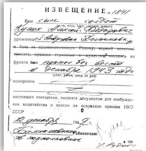
Солдат, що зник безвісті...