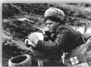
Медсестра на полі бою