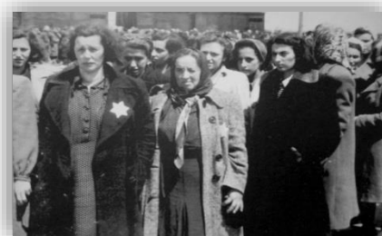
Єврейські жінки перед відправкою до табору смерті